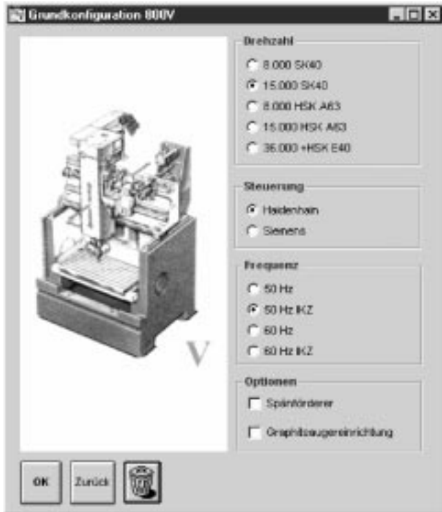
Abb. 1: Beispielapplikation mit ET-EPOS zur Konfiguration einer Maschine